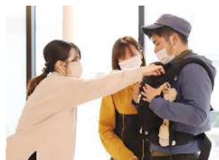
パパも一緒に、自身にあった抱っこ紐の特徴や使い方を学びます。