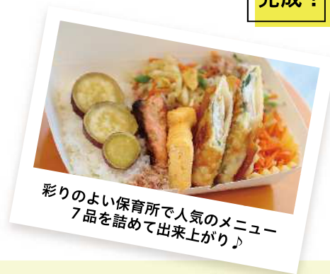
彩りのよい保育所で人気のメニュー7品を詰めて出来上がり♪