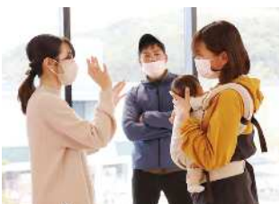
抱っこ紐を選ぶ大事なポイントを教えてください。