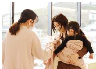
年齢や用途に合った結び方をアドバイスしてくれます。