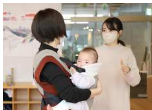
抱っこ紐を使って赤ちゃんを抱っこし、肩や腰紐の位置などをチェック。