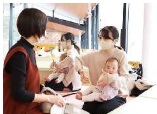
普段使っている抱っこ紐の使い方や困り事をお聞きします。