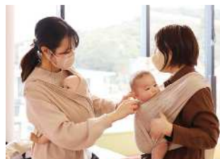
赤ちゃん和妈妈が楽な姿勢になる包み込み方をレクチャー♪